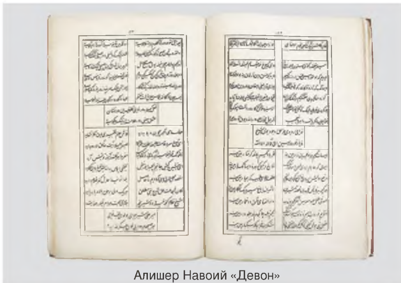
Алишер Навоий «Девон»

41 асарнигина қўшганда ҳам, умумий рақам 4585 тани ташкил этади.