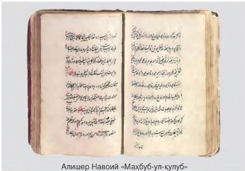
Алишер Навоий «Маҳбуб-ул-қулуб»

Достон – 21-жанр. Навоий олти достон битган. 22-жанр – тазира ( «Мажолис ун-нафоис», «Насойим ул-муҳаббат мин шамойим ул-футувват»). 23-жанр – ижтимоий-публицистик панднома («Маҳбуб ул-қулуб»). 24-жанр – мактуб (иншо) (103 мактубдан иборат «Муншаот»). 25-жанр – ҳолот-маноқиб («Ҳамсат ул-мутаҳаййирин» маноқиб, «Ҳолоти Саййид Ҳасан Ардашер», «Ҳолоти Паҳлавон Муҳаммад»). 26-жанр – илмий