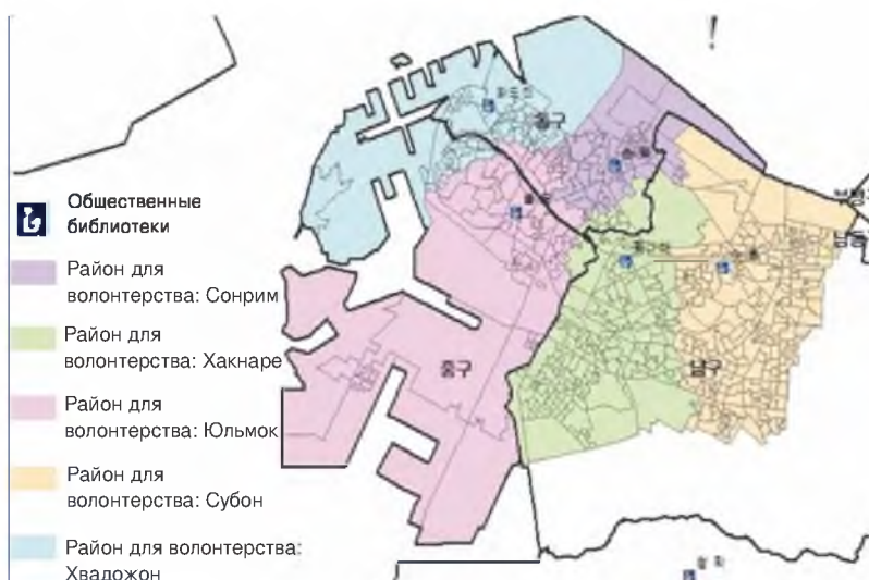
Рисунок 1. Область обслуживания библиотек, идентифицированная Thisessen Polygon

При разработке библиотечных услуг, основанных на характеристиках пользователей, критическая точка проектирования услуг – это определение демографических характеристик и потребностей населения, проживающих в районе, обслуживаемом библиотекой. Поэтому выравнивание области обслуживания библиотек может быть первым шагом для проектирования службы. Расположение зоны обслуживания обычно основано на административном округе. Например, зона обслуживания публичных библиотек в Сеонбук-гу (часть Сеула в Корее) совпадает с административным районом Сеонбук-гу. Однако, как указано в предыдущих исследованиях по доступности библиотек, поскольку использование библиотеки затрагивается не административной областью, а расстоянием от дома до библиотеки, необходимо, чтобы ее