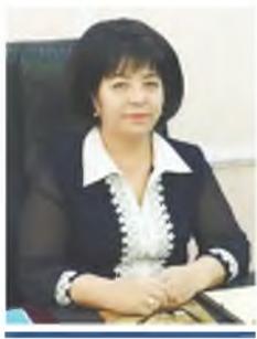
Жаннат Исмоилова, Ўзбекистон тарихи давлат музейи директори, тарих фанлари доктори