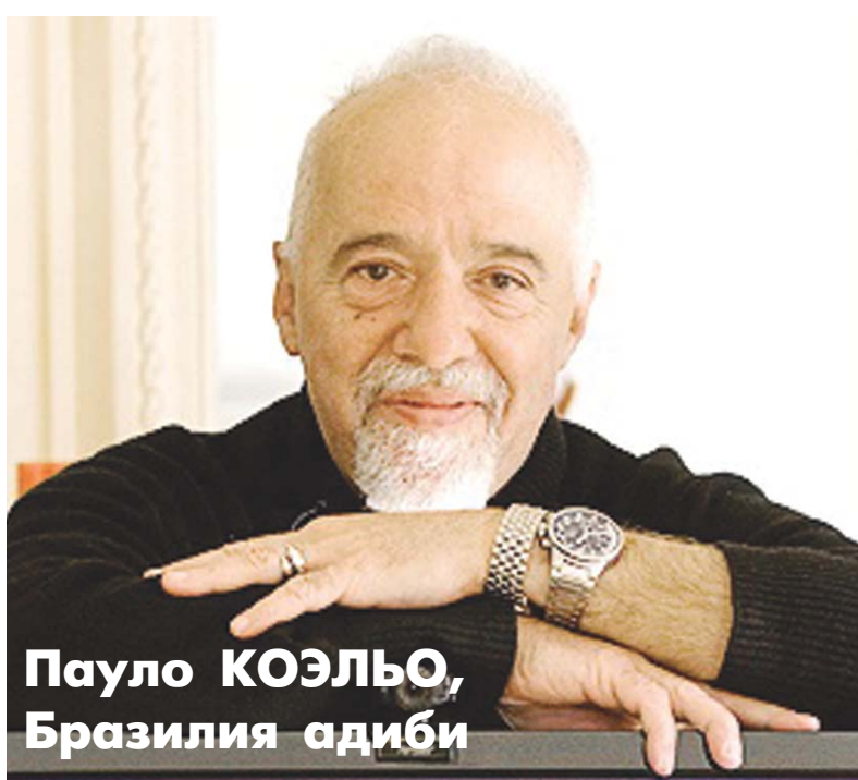
Пауло КОЭЛЬО, Бразилия адиби

— "АлкимеҒар"ни ўқигач, ҳайрат туйғусидан кўра кўпроқ умидсизликни ҳис қил- ган кўп одамларни биланман. Улар ҳаётни шунчаки сароб, бемаънилик, деб англаган... Бунга нима дейсиз?