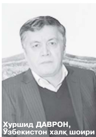
Хуршид ДАВРОН, Ўзбекистон халқ шоири

*** Яширасан сен кўзларингни, куз май тўла кўзларини ертўлага яширган каби. Яшир. Дийдан ҳасратдан қотган. Орамизда чўзилиб ётган сукунатни яширолмайсан.